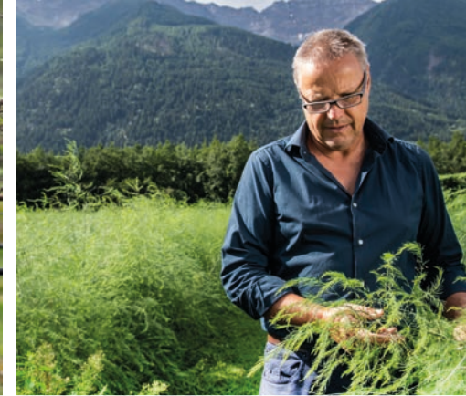
Grünlandwirtschaft, Acker- und Kräuteranbau, Freilandgemüsebau