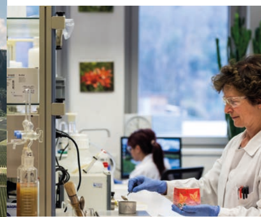
Agrikulturchemie, Molekular- und Mikrobiologie, Lebensmittelchemie