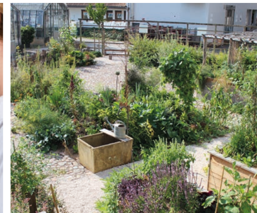
Zierpflanzen- und Landschaftsbau