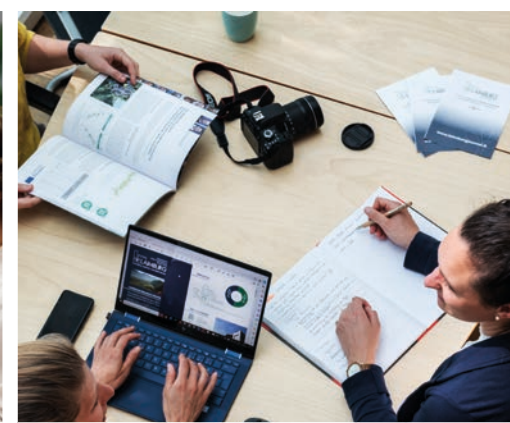
Verwaltung, Technische Dienste, Science Support, Strategy and Communication