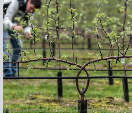
Obstbau, Weinbau und Önologie