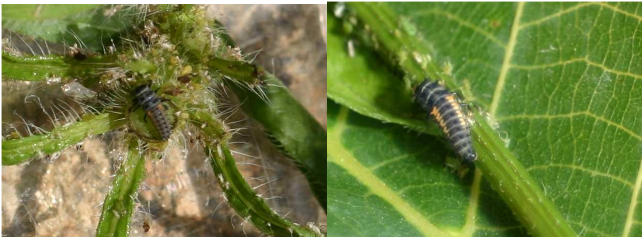
Abbildung 3: Das zweite Larvenstadiums (linke Abb.) des asiatischen Marienkäfers ist anhand der beginnenden Färbung der seitlichen orange Dornenreihen erkennbar. Das dritte Stadium (rechte Abb.) besitzt bereits die typische Dornenreihe.

Da man Larvenstadien des asiatischen Marienkäfers in der Regel besser bestimmen kann als den Käfer sind hier die wichtigsten, auch für den Laien erkennbaren Merkmale angeführt. Die Abbildungen stammen von Tieren aus unseren Zuchten. Die abgebildeten Larven sind Nachkommen der „succinea“ Farbvariation (siehe erste Abbildung a) bzw.b)). Das erste Larvenstadium weist keinerlei typische Färbung auf. Das zweite Larvenstadium besitzt bereits ansatzweise die Zeichnung des Abdomens, wobei nur ein seitlicher Punkt sichtbar ist (Abb. 3 links). Das dritte Larvenstadium (Abb. 3 rechts) zeigt bereits eine voll ausgeprägte Färbung der Dornen des Larvenkörpers. Es fehlen jedoch die „zentrale“ gefärbte Vierer-Dornengruppe (siehe Abbildung 4 letztes Larvenstadium).