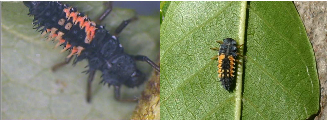
Abbildung 4: Die Larven asiatischen Marienkäfers sind anhand der seitlichen orange gefärbten Dornenreihen und der mittleren Dornengruppe gut erkennbar; dieses Muster tritt ausschließlich im letzten von vier Larvenstadien auf. Oben links Detail Larve, rechts Larve vor der Verpuppung.

Das letzte der vier Larvenstadien ist „typisch“ gezeichnet (siehe Abb. 4). Man erkennt mit bloßem Auge die seitliche Färbung und die „zentrale“ gefärbte Vierer-Dornengruppe.