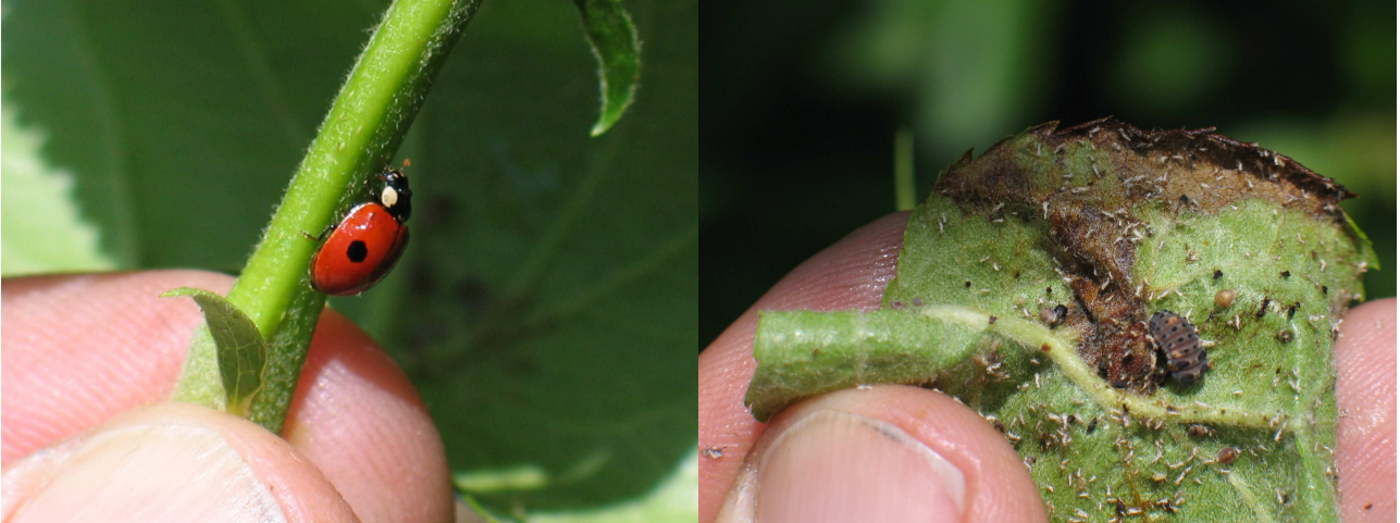
Abbildung 2: Der Zweipunktmarientkäfer ist eine in Obstanlagen häufige Art; Der Käfer (links) wie auch die Larven (rechts) weisen ein unverkennbares Punktmuster auf. Neben der abgebildeten roten Form gibt es weitere Farbtypen des Käfers.