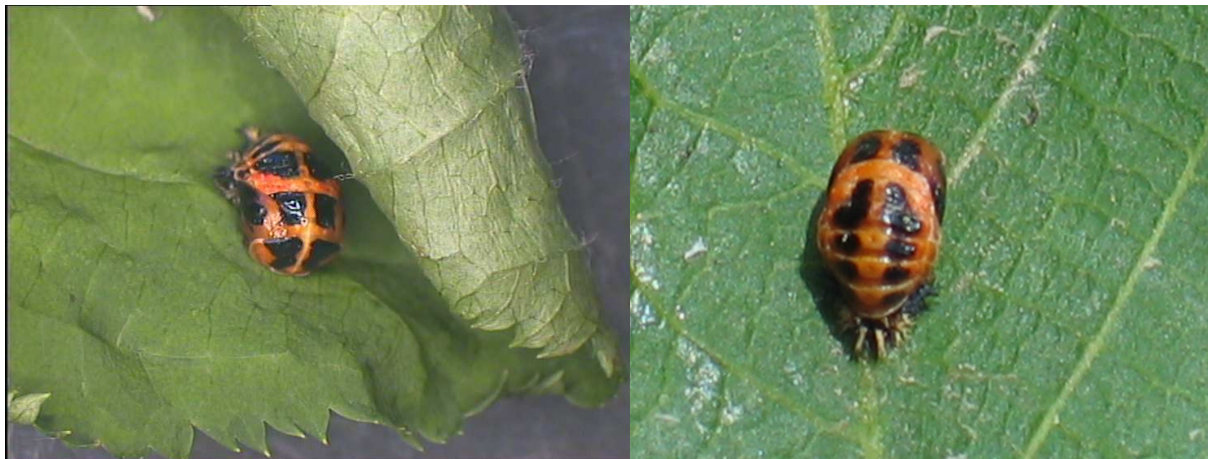
Abbildung 5: Die Puppen des asiatischen Marienkäfers findet man an der Blattoberseite angeheftet.

Die Puppen findet man meistens an der Blattoberseite angeheftet in der Nähe der Lauskolonien. Sie fallen insbesondere durch ihre Größe auf.